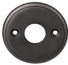
FINITION NOIR MAT