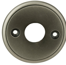
FINITION NICKEL VIEILLI