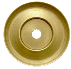
FINITION LAITON BROSSÉ