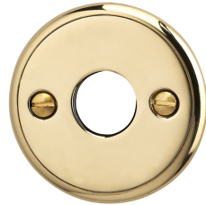
FINITION LAITON POLI VERNI OU NON VERNI