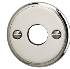
FINITION NICKEL BRILLANT