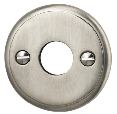
FINITION NICKEL SATINÉ