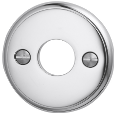
FINITION LAITON CHROMÉ