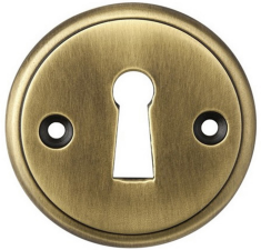
FINITION VIEUX LAITON VERNI MAT